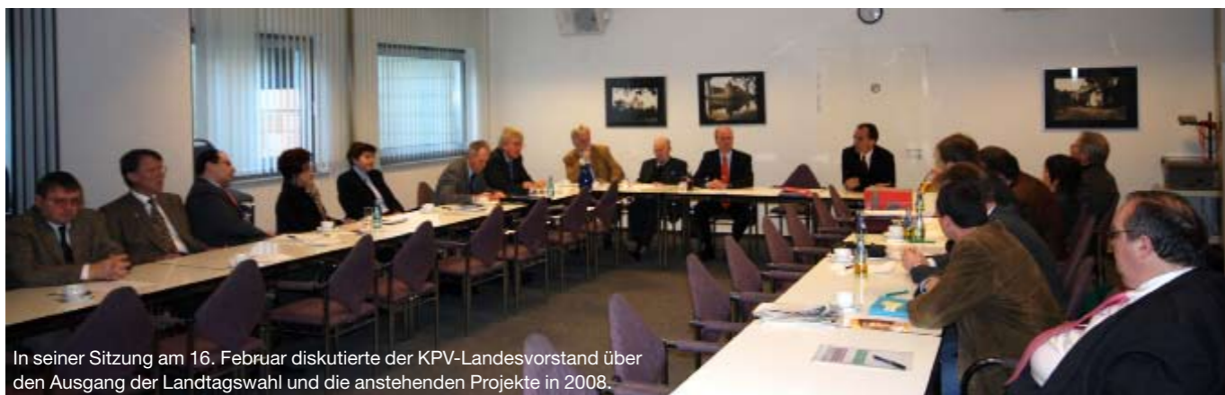
In seiner Sitzung am 16. Februar diskutierte der KPV-Landesvorstand über den Ausgang der Landtagswahl und die anstehenden Projekte in 2008.