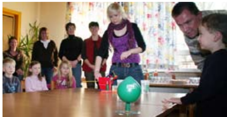
Eine CD-Rom, die sich mit Hilfe eines Luftballons zum Luftkissen entwickelt und über die Spieltische schwebt.

Die speziell für die Technikbildung im Vorschulalter entwickelten und zusammengestellten Technikkoffer unterstützen das technische Verständnis der Kinder. Die Koffer enthalten Materialien zu den Themen Wasser, Luft, Farben, Schall und Elektrizität, mit denen mehr als 100 erprobte Experimente durchgeführt werden können.