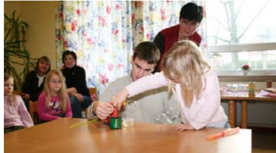
Um Spaß und Neugierde an naturwissenschaftlichen Phänomenen zu wecken, sind die Experimente einfach und motivierend gestaltet. Die Kinder können sie in Eigenregie durchführen.

Ein paar davon zogen die Kinder sofort in ihren Bann. Dass ein Ei im Wasserglas untergeht, das war den Kindern klar. Schließlich ist ein Ei schwer. Als das Ei im Glas mit Salzwasser aber oben geschwommen ist, wollten die Kleinen schon wissen, ob es vielleicht ein ausgeblasenes Ei ist. Fasziniert hat natürlich die Seifenblasenmaschine, die jeder mal in Gang setzen wollte. Oder die CD, die sich mit Hilfe eines Luftballons zum Luftkissen entwickelte und über die Spieltische schwebte.