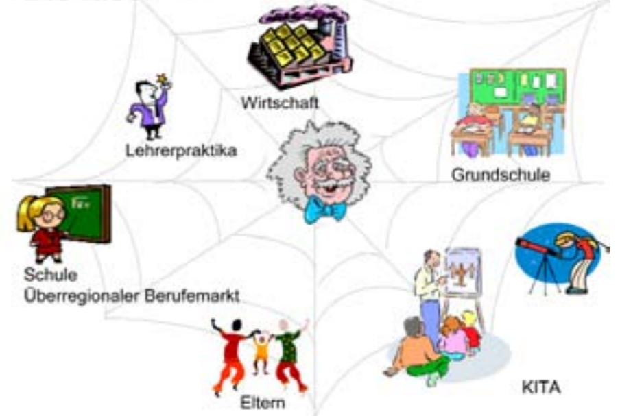
Die Perspektiven für die Zukunft schafft man in der Gegenwart.